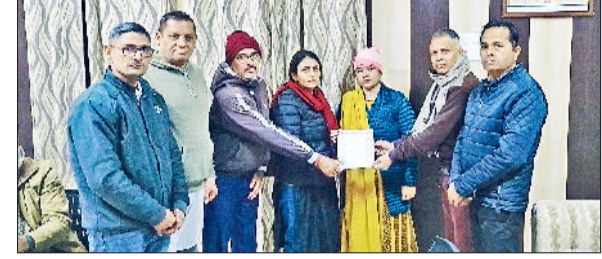
करनाल। सहकारी बैंक कर्मचारी रोष प्रदर्शन करते हुए।