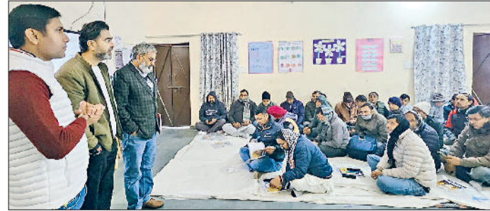
इंदी। प्रशिक्षण कार्यक्रम में अध्यापकों को प्रशिक्षण देते ट्रेनर।

सुधारात्मक पग उठाना मुख्य काम है। उन्होंने बताया कि गणित में बच्चों को निपुणता बढ़ाने के लिए कक्षा दूसरी व तीसरी कक्षा के बच्चे की रेमेडियल कार्य की आवश्यकता को समझना जरूरी है। उन्होंने कहा कि गणित की अवधारणा एक दूसरे से जुड़ी होती है और नई अवधारणा