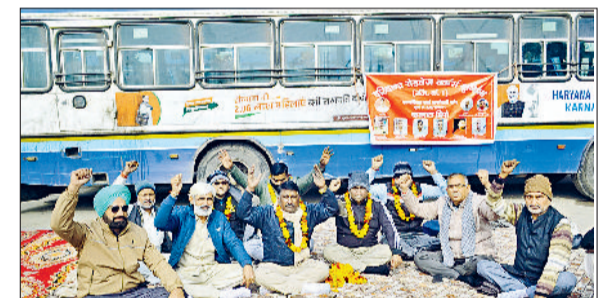
करनाल। पुराना बस स्टैंड पर भूख हड़ताल पर बैठे रोडवेज कर्मचारी।